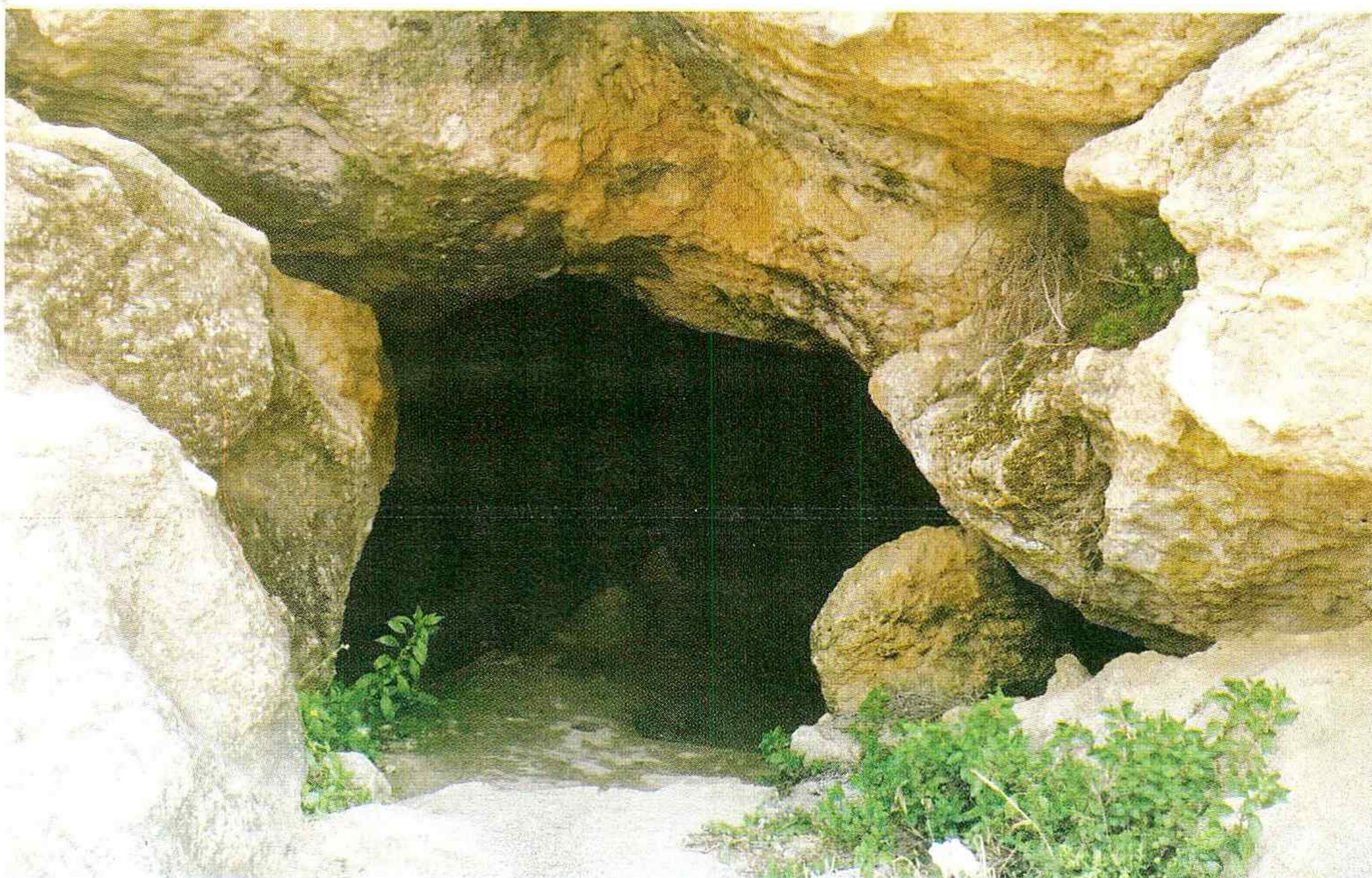
מערת אביגיל

לפרטים נוספים על כל האפשרויות בחבל יתיר 08-6254802 www.goyatir.co.il