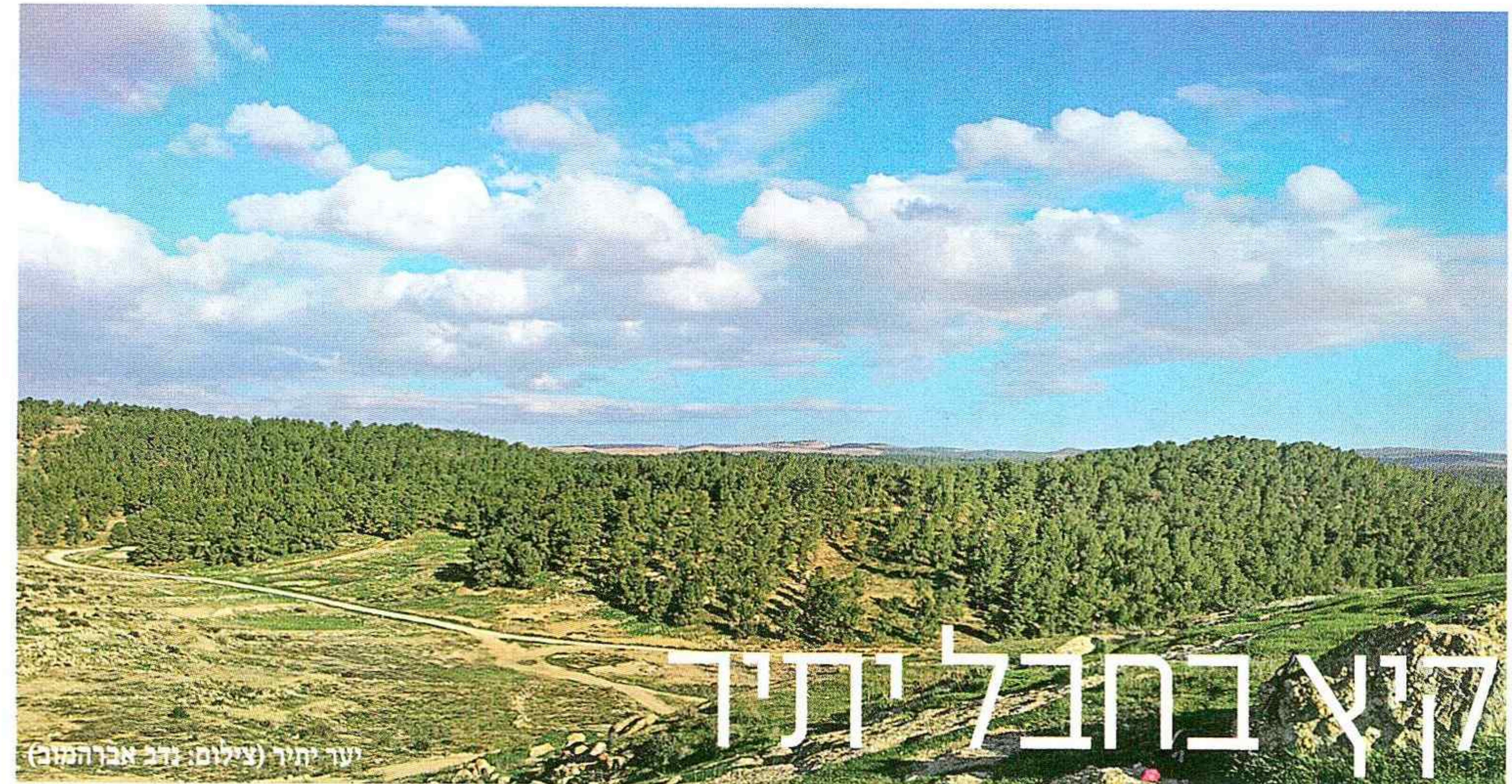
יער יתיר

שום ביקור בחבל יתיר לא יהיה שלם בלי עצירה באתר סוסיא הקדומה - אתר עתיקות חוויתי ויפהפה המחזיר את המבקרים במנהרת הזמן אל תקופת התלמוד לפני 1,500