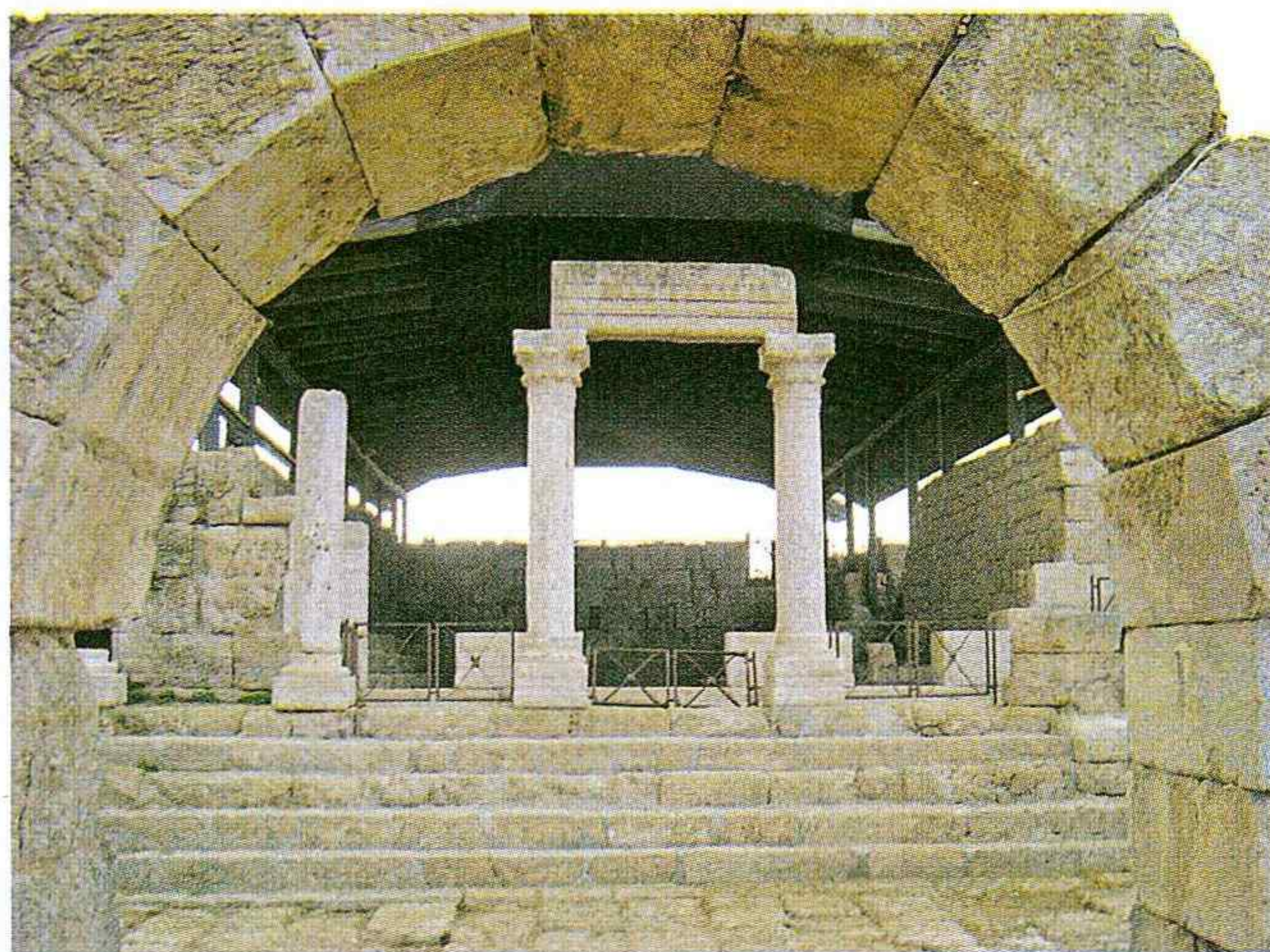
עמודי סוסיא

שנה. באתר מתהלכים בין שרידי היישוב הקדום שהתקיים במקום,